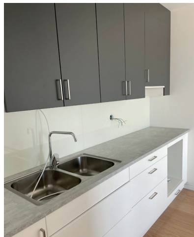
Kök. Har en social planlösning med trevligt kök från Ballingslöv och förberett för diskmaskin.